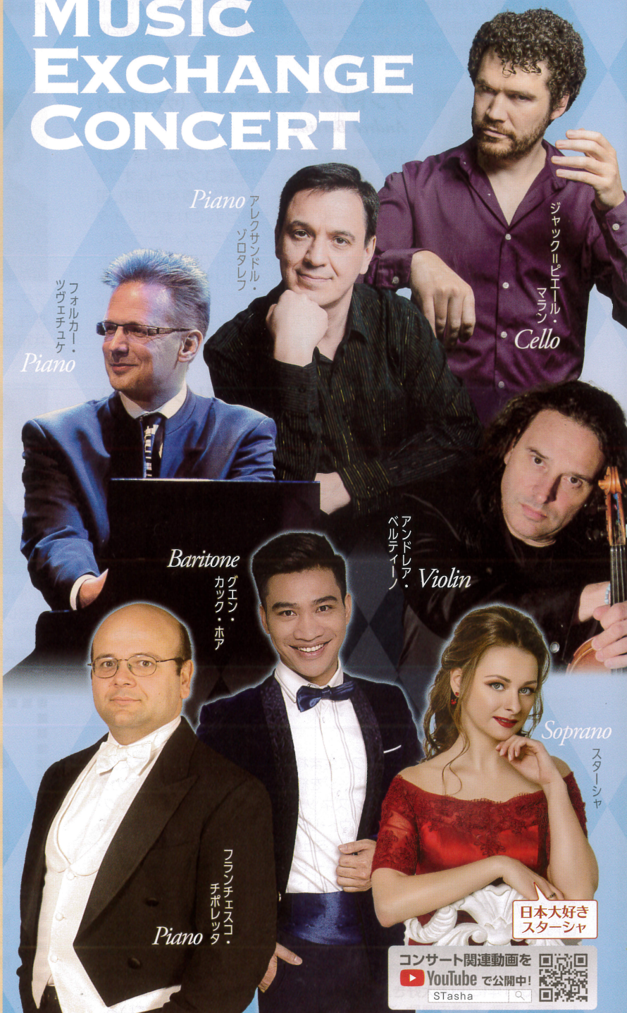
Piano ツウエチユケ フォルカー