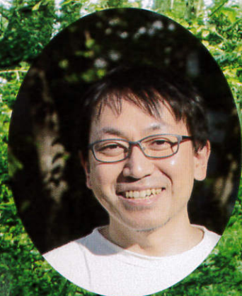
作曲、編曲：大曾根 浩範