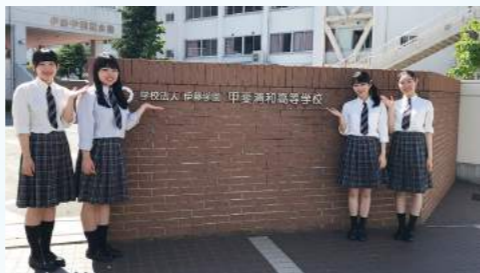
せいか音楽祭 実行委員会