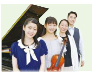
Lacrima di Esperanza ラクリマ ディ エスベランツァ

若草中学校出身。甲斐清和高校音楽科3年在籍。 2019年5月 YouTube「クマーパチャンネル」に童謡歌手として出演。現在配信中。テレビ朝日音楽チャンプ優勝。関ジャニ∞のThe モーツァルト音楽王No1 決定戦準決勝進出。 2018年NHKのど自慢山梨大会優勝。チャンピオン大会に出場。高校生ボーカリストアワード優勝。2016年全国こどものうたコンクール全国大会金賞。