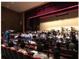
SEIKA スペシャルバンド

佐賀県出身。国立音楽大学卒業。同大学院音楽研究科ピアノコースを首席で修了。最優秀賞並びにクロイツァー賞を受賞。現在は様々なジャンルの音楽を演奏することはもとより、作編曲やピアノ弾き語り、アーティストへの楽曲提供、CM楽曲制作・出演 (Canon、洗剤 Nanox) など、多岐にわたる音楽活動を展開中。2018年より KOSEI として本格的にソロ活動を開始し、ピアニスト兼ボーカリストという独自のスタイルを確立。Arco Iris、Storyteller、つぼはちのメンバーとしても都内を中心に活動中。